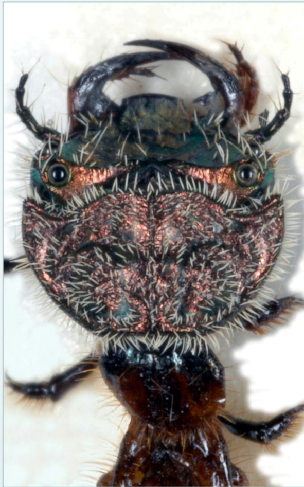
Larve av elvesandjeger ( Cicindela maritima ) som viser hode og brystskjold ovenfra.